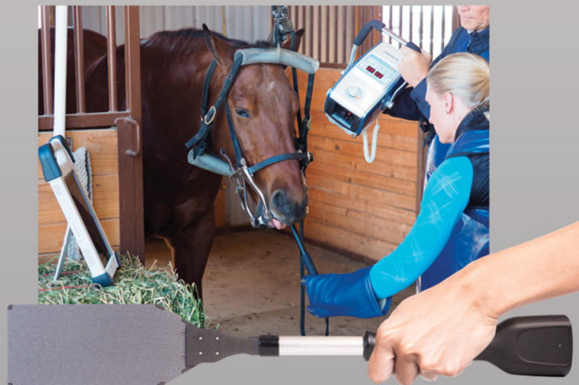
Détecteur numérique de rayons X Denti Pod intraoral Zone d'imagerie de 100 mm x 150 mm

© 2020 Heska Corporation. Tous droits réservés. HESKA et scil sont des marques déposées et Cuattro Hub, Sono Pod et Denti Pod sont des marques de commerce de Heska Corporation aux États-Unis et dans d'autres pays. Les spécifications, les prix, les concepts et la disponibilité peuvent changer sans préavis. Pour obtenir les détails les plus récents, adressez-vous à un représentant Heska. CA20LT0604_001_FR